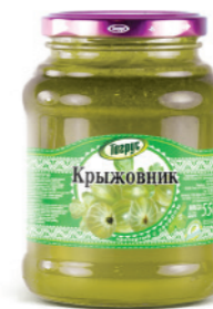
КРЫЖОВНИК 300/550 г

Фасовка: твист, стекло Кол-во в упаковке: 8/12 Срок годности: 2 года 🌡️ от 0 °С до +25 °С