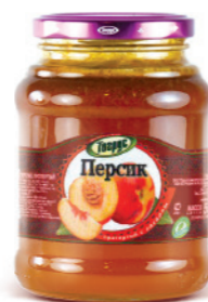
ПЕРСИК 300/550 г

Фасовка: твист, стекло Кол-во в упаковке: 8/12 Срок годности: 2 года 🌡️ от 0 °С до +25 °С