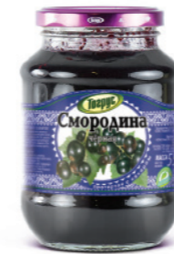
ЧЁРНАЯ СМОРОДИНА 300/550 г

Фасовка: твист, стекло Кол-во в упаковке: 8/12 Срок годности: 2 года 🌡️ от 0 °С до +25 °С