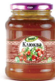
КЛЮКВА 300/550 г

Фасовка: твист, стекло Кол-во в упаковке: 8/12 Срок годности: 2 года 🌡️ от 0 °С до +25 °С