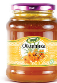
ОБЛЕПИХА 300/550 г

Фасовка: твист, стекло Кол-во в упаковке: 8/12 Срок годности: 2 года 🌡️ от 0 °С до +25 °С