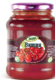
ВИШНЯ 300/550 г

Фасовка: твист, стекло Кол-во в упаковке: 8/12 Срок годности: 2 года 🌡️ от 0 °С до +25 °С