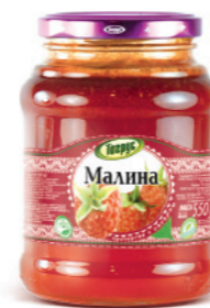
МАЛИНА 300/550 г

Фасовка: твист, стекло Кол-во в упаковке: 8/12 Срок годности: 2 года 🌡️ от 0 °С до +25 °С