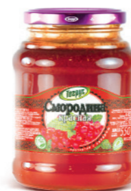
КРАСНАЯ СМОРОДИНА 300/550 г

Фасовка: твист, стекло Кол-во в упаковке: 8/12 Срок годности: 2 года 🌡️ от 0 °С до +25 °С