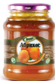
АБРИКОС 300/550 г

Фасовка: твист, стекло Кол-во в упаковке: 8/12 Срок годности: 2 года 🌡️ от 0 °С до +25 °С