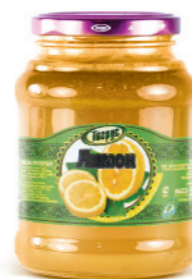
ЛИМОН 300/550 г

Фасовка: твист, стекло Кол-во в упаковке: 8/12 Срок годности: 2 года 🌡️ от 0 °С до +25 °С