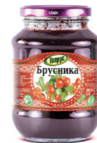
БРУСНИКА 300/550 г

Фасовка: твист, стекло Кол-во в упаковке: 8/12 Срок годности: 2 года 🌡️ от 0 °С до +25 °С