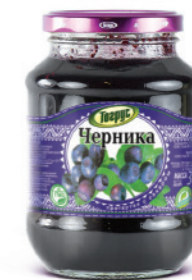
ЧЕРНИКА 300/550 г

Фасовка: твист, стекло Кол-во в упаковке: 8/12 Срок годности: 2 года 🌡️ от 0 °С до +25 °С