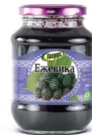
ЕЖЕВИКА 300/550 г

Фасовка: твист, стекло Кол-во в упаковке: 8/12 Срок годности: 2 года 🌡️ от 0 °С до +25 °С