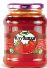
КЛУБНИКА 300/550 г

Фасовка: твист, стекло Кол-во в упаковке: 8/12 Срок годности: 2 года 🌡️ от 0 °С до +25 °С