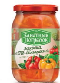
ЗАКУСКА ПО-БОЛГАРСКИ 500 г

Фасовка: твист, стекло Кол-во в упаковке: 12 Срок годности: 12 месяцев 🌡️ от 0 °C до +25 °C