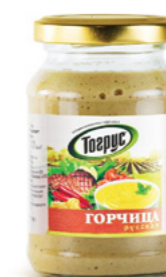
ГОРЧИЦА РУССКАЯ 190 г

Фасовка: твист, стекло Кол-во в упаковке: 8 Срок годности: 1 год 🌡️ от 0 °C до +25 °C