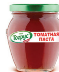
ТОМАТНАЯ ПАСТА 27% 600 г

Фасовка: твист, стекло Кол-во в упаковке: 8 Срок годности: 2 года 🌡️ от 0 °C до +25 °C