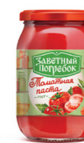
ТОМАТНАЯ ПАСТА 30% 500/1000 г

Фасовка: твист, стекло Кол-во в упаковке: 15 Срок годности: 1 год 🌡️ от 0 °C до +18 °C