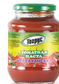
ТОМАТНАЯ ПАСТА АСТРАХАНСКАЯ 500/900/1500 г

Фасовка: туба, пластик Кол-во в упаковке: 24 Срок годности: 1 год 🌡️ от 0 °C до +18 °C