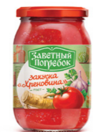
ЗАКУСКА ХРЕНОВИНА 500 г

Фасовка: твист, стекло Кол-во в упаковке: 12/6 Срок годности: 24 месяца 🌡️ от 0 °C до +25 °C