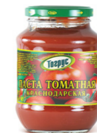
ТОМАТНАЯ ПАСТА КРАСНОДАРСКАЯ 270/500/900/1500 г

Фасовка: твист, стекло Кол-во в упаковке: 12/6/4 Срок годности: 1 год 🗂️ Вес при фасовке в ведро: 1100 г В упаковке: 6 шт. Срок годности: 6 месяцев 🌡️ от 0 °C до +25 °C