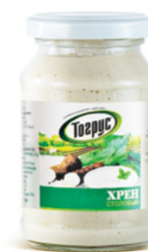
ХРЕН СТОЛОВЫЙ 190 г

Фасовка: твист, стекло Кол-во в упаковке: 20/12/6/4 Срок годности: 1 год 🗂️ Вес при фасовке в ведро: 1100 г В упаковке: 6 шт. Срок годности: 6 месяцев 🌡️ от 0 °C до +25 °C