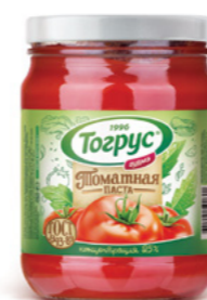
ТОМАТНАЯ ПАСТА 27% 280/500/1000 г

Горчица и хрен «Тогрус» – острые приправы, которые идеально подходят для рыбных и мясных блюд.